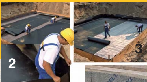
Заделка герметизирующего полотна (деталь)