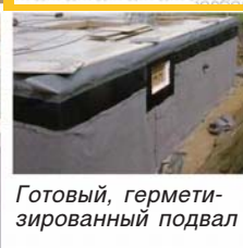
Готовый, герметизированный подвал